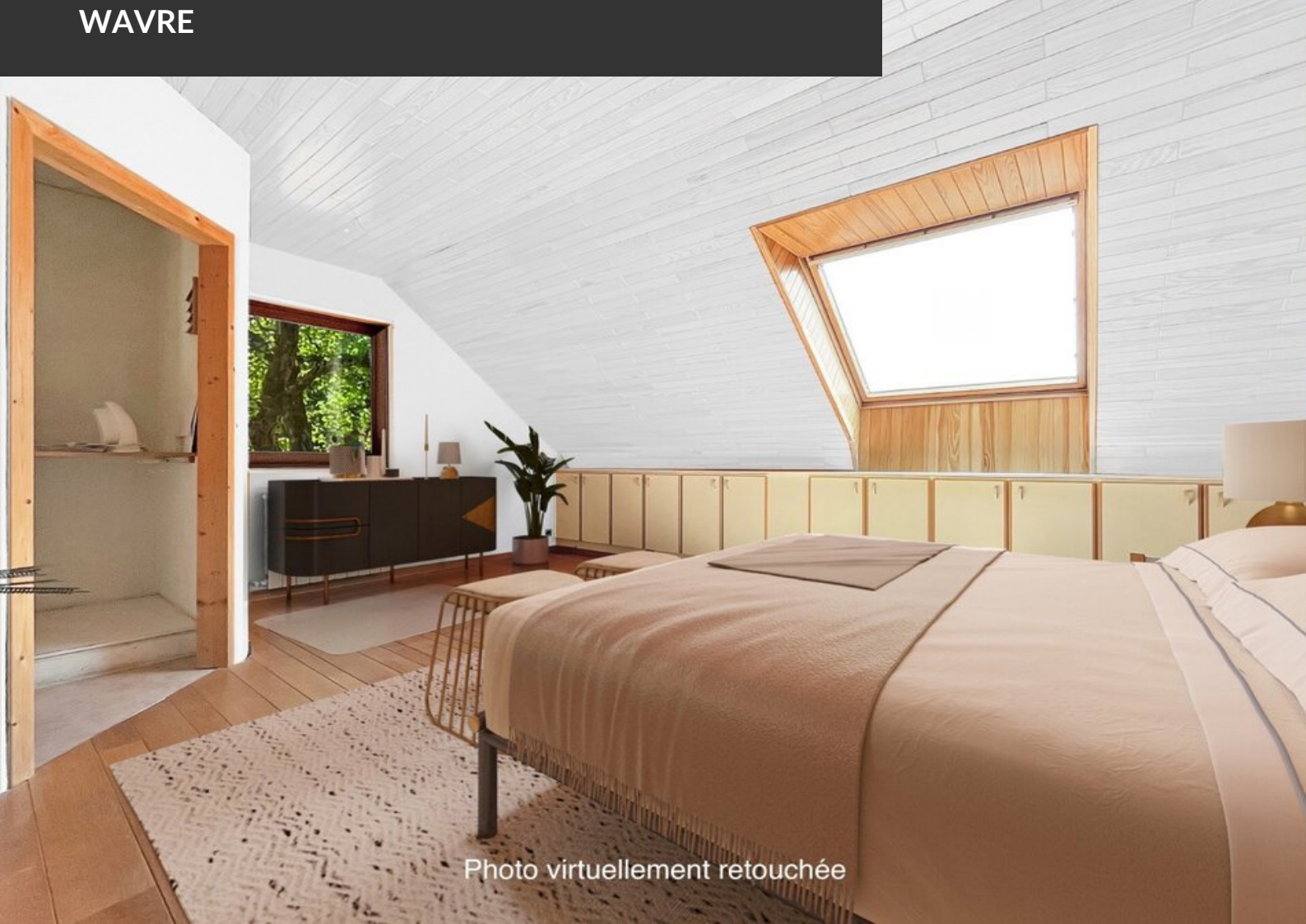
Photo virtuellement retouchée