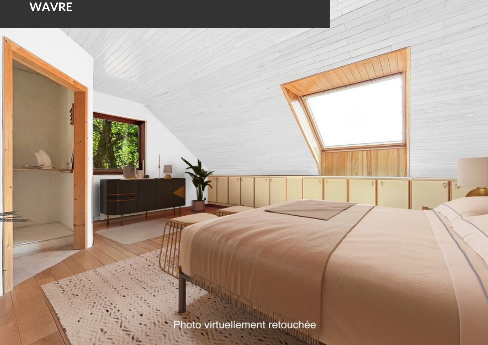
Photo virtuellement retouchée